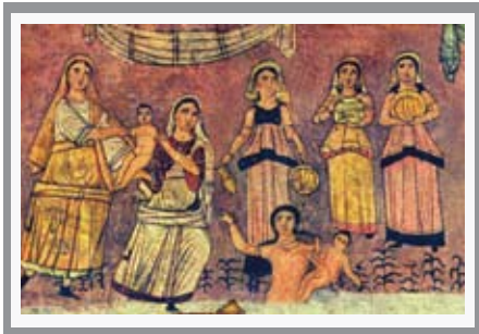
A Dura Europos-i zsinagóga freskói, Sámuel királlyá keni fel Dávidot (felső kép), a gyermek Mózes megmentése Egyiptomban az üldözéstől (alsó kép).

jatlan volt és a mellkasra annyira szorosan volt rácsavarva, hogy a mell formája teljesen látható volt. Isten népe mindig elfedte a felkart viseletében és lazán tartak a mellkast a felsőruházatával. Természetesen a görög kultúrában nagy szerepet játszott a meztelenség mindkét nemből, a férfiaknál és nőknél egyaránt.